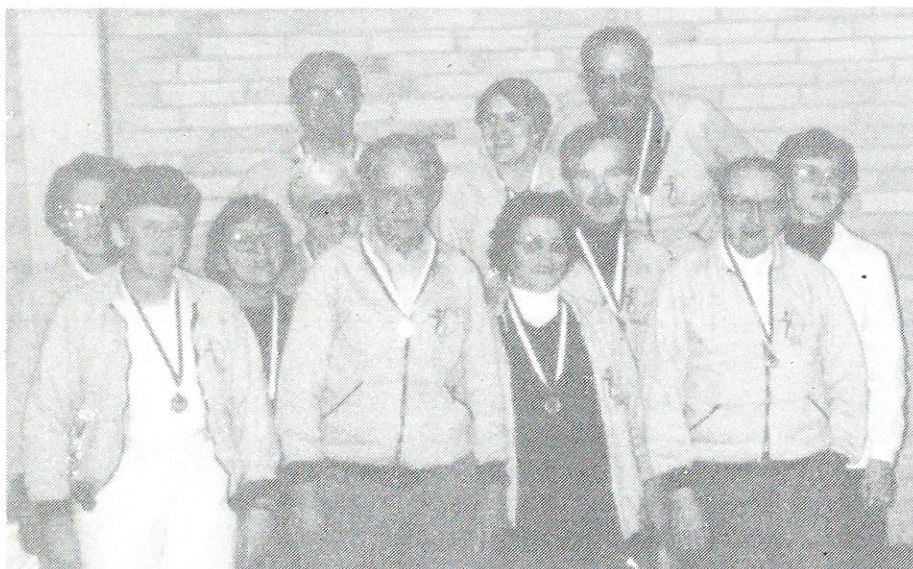
Her ses de fire hold som alle fik medalje og kvalificerede sig til FM.