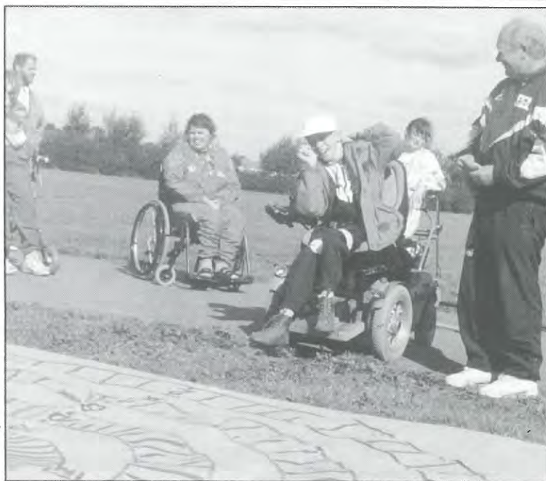
Jacob rammer plet.